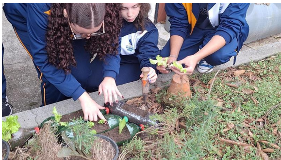
Oficina de Horta Residencial - Objetivo: ensinar a comunidade a trabalhar com compostagem e horta de pequeno porte