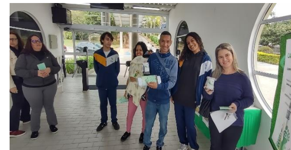
Comunidade externa recebendo os kits plantio