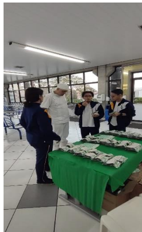
Distribuição dos kits plantio aos funcionários do Centro Educacional