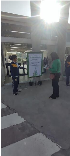
Uso da Calculadora de Carbono