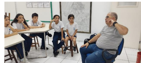
Preparação do comitê para a elaboração do Documentário: Racismo Ambiental - Orientador: pai de ex aluno voluntário