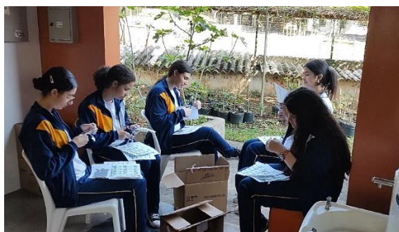
Confecção dos kits plantios - Comitê de alunos do projeto