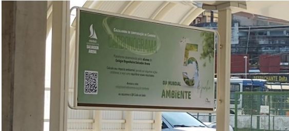
Divulgação da Calculadora de Carbono a Comunidade externa através de banner