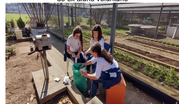
Confecção dos kits plantios - Comitê de alunos do projeto