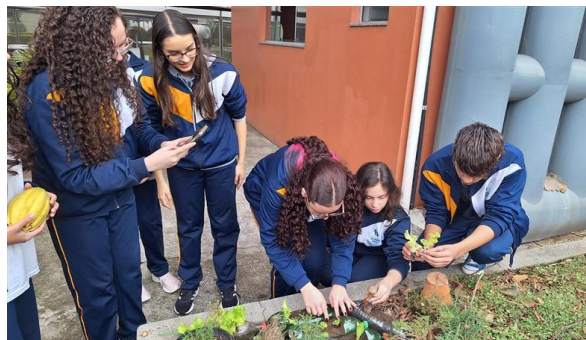
Oficina de Horta Residencial - Objetivo: ensinar a comunidade a trabalhar com compostagem e horta de pequeno porte