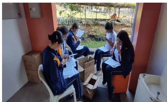
Confecção dos kits plantios - Comitê de alunos do projeto