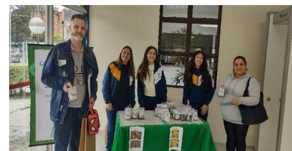
Entrega de kits plantio aos pais de alunos