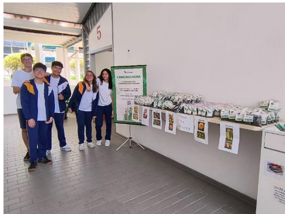
Distribuição de kits aos alunos do colégio