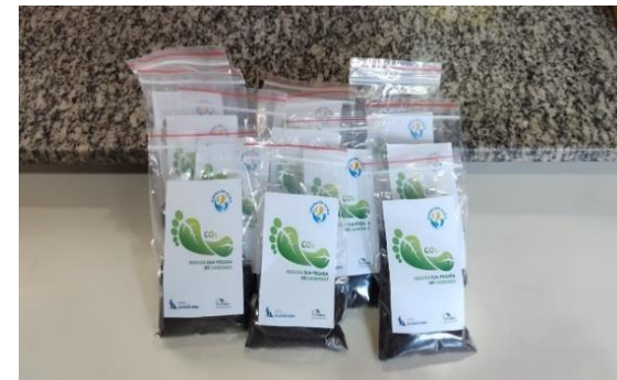
Kits plantio de sementes