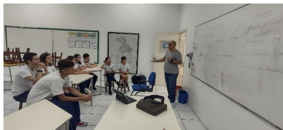
Preparação do comitê para a elaboração do Documentário: Racismo Ambiental