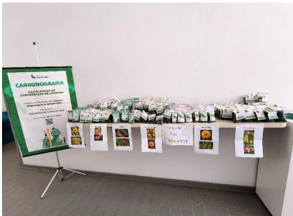
Distribuição de kits aos alunos do colégio