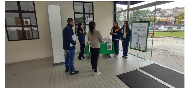
Uso da Calculadora de Carbono