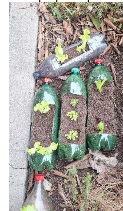
Oficina de Horta Residencial - Objetivo: ensinar a comunidade a trabalhar com compostagem/reciclagem e horta de pequeno porte