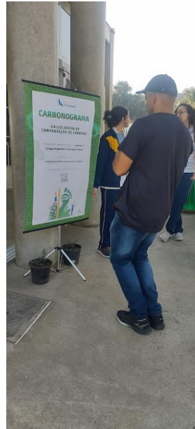
Uso da Calculadora de Carbono