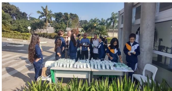
Distribuição dos kits plantio aos pais