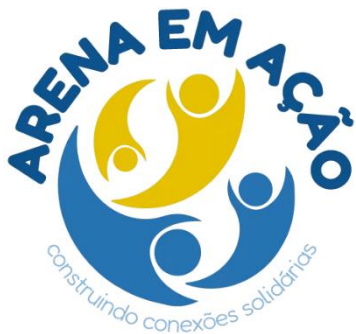
Identificação visual do projeto