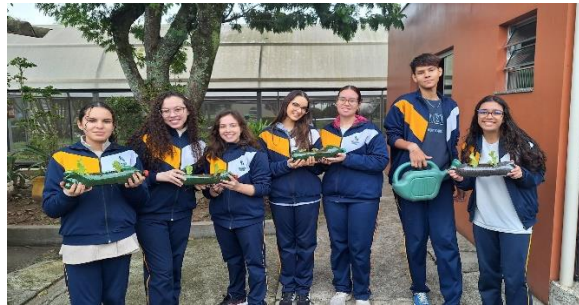
Oficina de Horta Residencial - Objetivo: ensinar a comunidade a trabalhar com compostagem e horta de pequeno porte