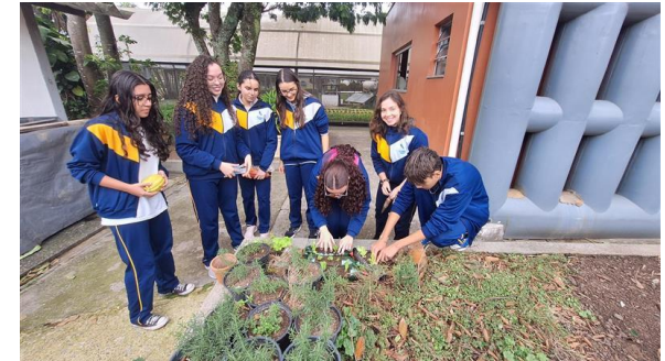
Oficina de Horta Residencial - Objetivo: ensinar a comunidade a trabalhar com compostagem e horta de pequeno porte