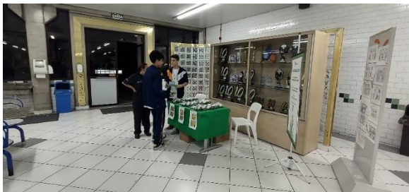
Distribuição dos kits plantio aos funcionários do Centro Educacional