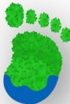
Identificação visual do tema Pegada Ecológica