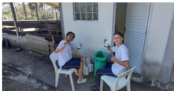
Confecção dos kits plantio - Comitê de alunos do projeto