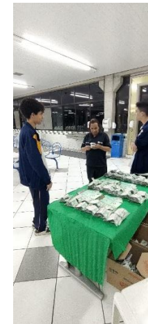
Distribuição dos kits plantio aos funcionários do Centro Educacional