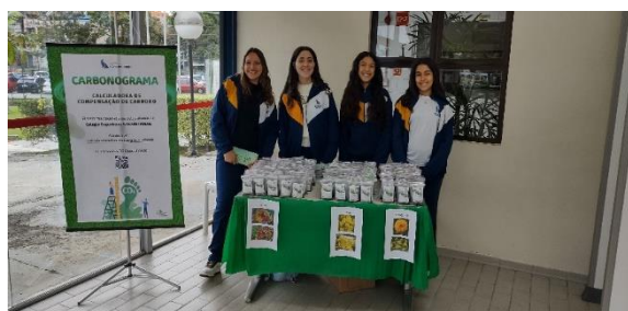
Banner de acesso à calculadora e entrega dos kits plantio