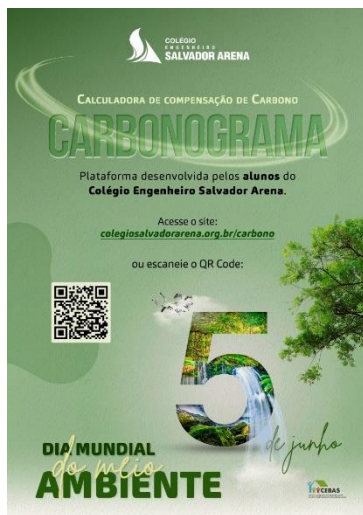
Material de Divulgação da Calculadora de Carbono