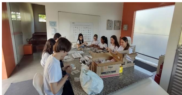
Confecção dos kits plantio - Comitê de alunos do projeto